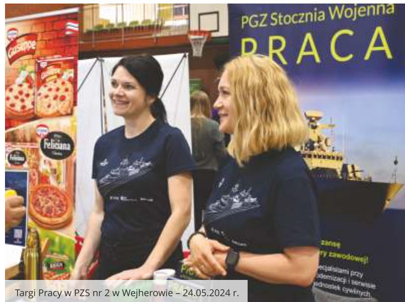
Targi Pracy w PZS nr 2 w Wejherowie – 24.05.2024 r.

Spotkanie informacyjne dla uczniów klas VII i VIII, rodziców i opiekunów prawnych, dotyczące wyboru dalszej ścieżki kształcenia nastolatków. Spotkanie odbędzie się 10 kwietnia 2025 r. o godz. 16:30 w Centrum Kultury i Biblioteka w Gniewinie, ul. Sportowa 1. Spotkanie będzie dotyczyło ofert edukacyjnych w szkołach ponadpodstawowych z terenu powiatu wejherowskiego. Szczegółowe informacje będą dostępne bliżej terminu wydarzenia.