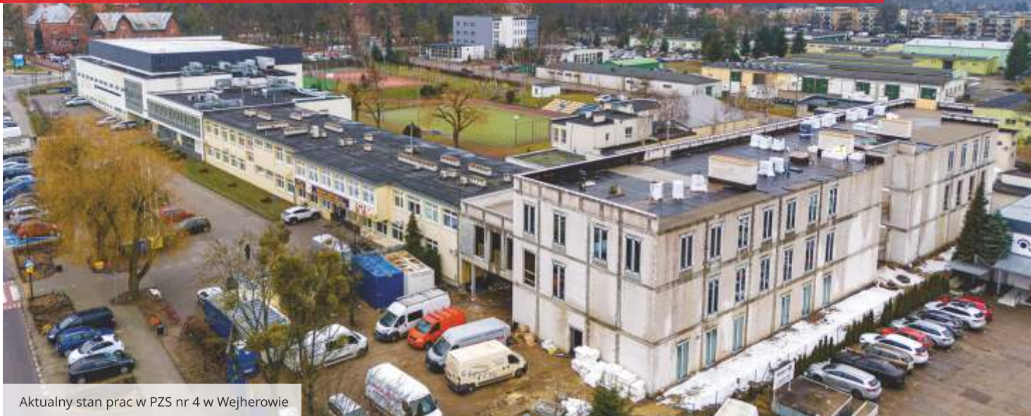
Aktualny stan prac w PZS nr 4 w Wejherowie

Na terenie powiatu wejherowskiego trwają ważne inwestycje oświatowe, które całkowicie odmienią oblicze powiatowych placówek edukacyjnych. Rozbudowa szkół to odpowiedź na rosnące potrzeby uczniów i nauczycieli oraz konieczność dostosowania obiektów do współczesnych standardów edukacyjnych i potrzeb lokalnych.