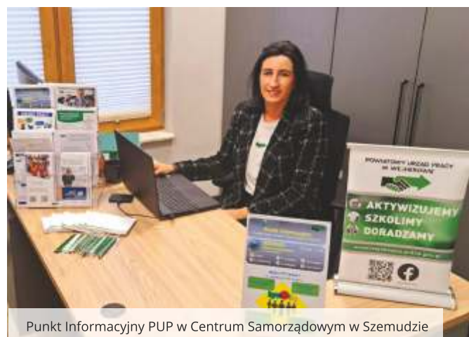
Punkt Informacyjny PUP w Centrum Samorządowym w Szemudzie

Staż – to nabywanie przez osobę bezrobotną umiejętności praktycznych do wykonywania pracy, poprzez wykonywanie zadań w miejscu pracy, bez nawiązywania stosunku pracy między pracodawcą a skierowaną na staż osobą bezrobotną. Okres trwania nowych, organizowanych w 2025 r. staży wyniesie od 3 do 6 miesięcy. Osoby uczestniczące w stażu będą mogły korzystać z refundacji kosztów opieki nad dzieckiem.