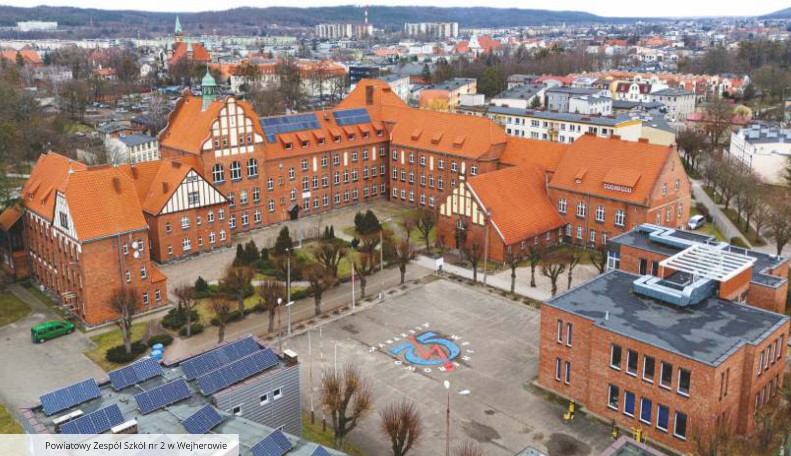
Powiatowy Zespół Szkół nr 2 w Wejherowie