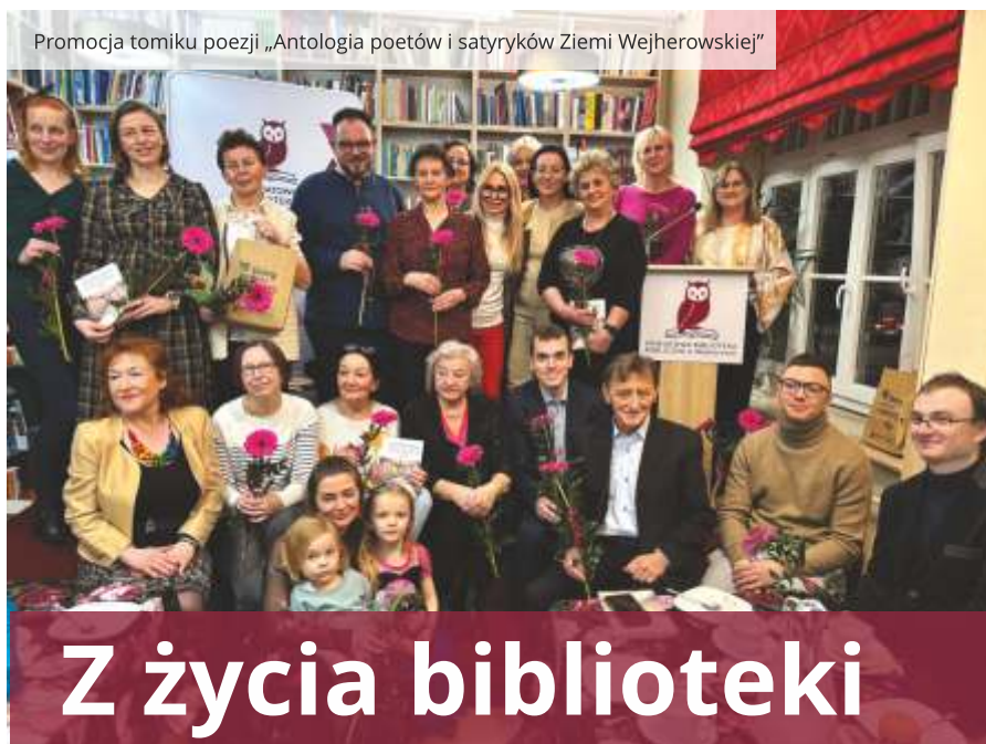
Promocja tomiku poezji „Antologia poetów i satyryków Ziemi Wejherowskiej”