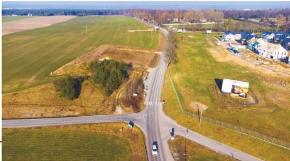
Droga powiatowa na odcinku Gowino – Pętkowice, która ma być przebudowana w latach 2025-2026

Duże inwestycje drogowe w 2025 r. będą związane z pozyskaniem środków rządowych z programu wspierania inwestycji samorządowych, powstałego w grudniu 2023 r. w związku z budową elektrowni jądrowej. Program ten przewiduje 72 mln złotych na inwestycje w Powiecie Wejherowskim w latach 2024-2028.