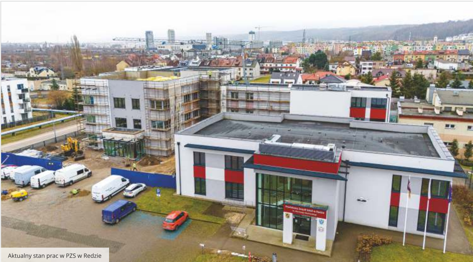
Aktualny stan prac w PZS w Redzie

- Obiekt osiągnął stan surowy zamknięty. Wykonano już instalację centralnego ogrzewania, kanalizacyjną oraz elektryczną. Dodatkowo, wymienione zostało ogrodzenie od strony ulicy Cichej. W pięćdziesięciu procentach zrealizowano również prace związane z zagospodarowaniem terenu wokół szkoły, w tym z budową parkingu. W tej chwili prowadzone są roboty wykończeniowe. Wewnątrz budynku układana jest glazura oraz montowana armatura sanitarna. Na zewnątrz trwają prace związane z ociepleniem budynku, a także z wykonaniem elewacji - mówi Dyrektor PZS w Redzie Dorota Nowicka-Klimowicz.