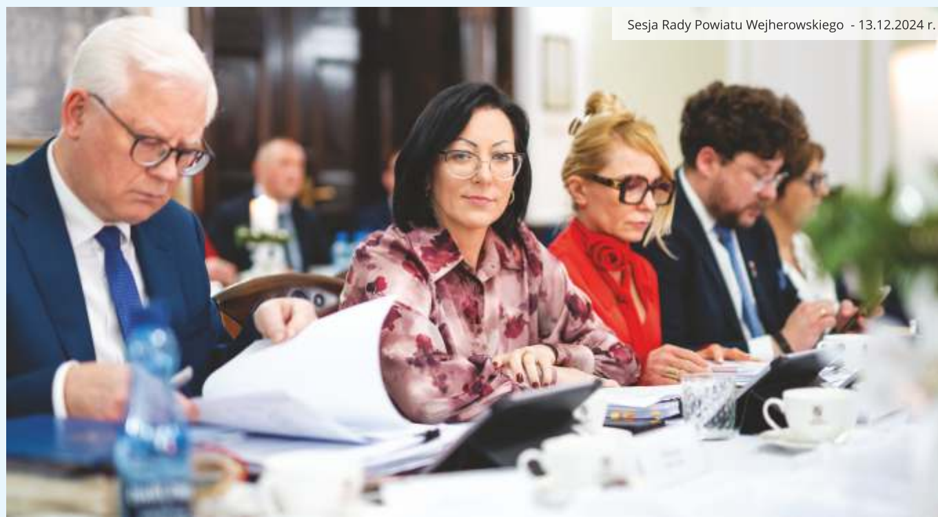
Sesja Rady Powiatu Wejherowskiego - 13.12.2024 r.

Pracę z ludźmi. Zawsze, gdy staję przed współpracownikami, mówię: „Zrealizowaliśmy ten projekt”, bo za każdym osiągnięciem stoją ludzie i często miesiące, a nawet lata ciężkiej pracy. W pojedynkę nic się nie osiągnie – to współpraca, zespół i drużyna stanowią fundament sukcesu każdego projektu i przedsięwzięcia. Wielkie rzeczy są wynikiem wspólnej pracy, zaangażowania i zespołowego wysiłku. Uważam, że tylko efektywna współpraca pozwala skutecznie rozwiązywać problemy, łącząc różnorodne umiejętności i doświadczenia. Nie wyobrażam sobie, aby nie inwestować w ten obszar. Ludzie stanowią fundament mojej pracy i funkcjonowania samorządu. Poza tym cenię współpracę i budowanie dobrych relacji z koleżankami i kolegami samorządowcami z innych jednostek – zarówno z przedstawicielami władz (członkami zarządu i radnymi), jak i pracownikami urzędów. Warto podtrzymywać dobre stosunki, współdziałać i wymieniać się doświadczeniami.