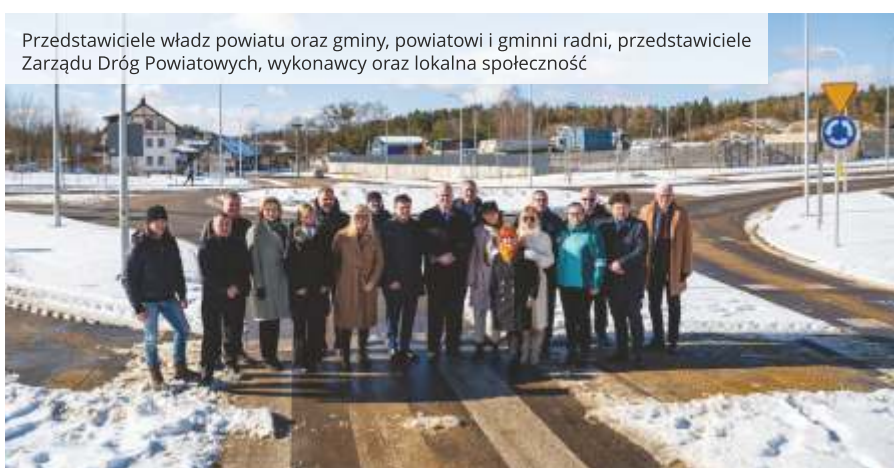
Przedstawiciele władz powiatu oraz gminy, powiatowi i gminni radni, przedstawiciele Zarządu Dróg Powiatowych, wykonawcy oraz lokalna społeczność

W ramach inwestycji na skrzyżowaniu drogi powiatowej z drogami gminnymi: ulicą Wierzbową i Aleją Parku Krajobrazowego wybudowano rondo o średnicy 30 m. Wykonane zostały chodniki, ścieżki rowerowe oraz ścieżki pieszo-rowerowe bitumiczne, a także dwa przystanki autobusowe z zatokami. Powstały także cztery doświetlone przejścia dla pieszych, co znacząco podniesie komfort i bezpieczeństwo niechronionych uczestników ruchu.