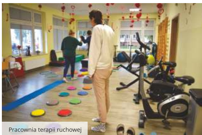
Pracownia terapii ruchowej

Na terenie powiatu wejherowskiego od ponad roku funkcjonuje Środowiskowy Dom Samopomocy, który mieści się przy ulicy Krasińskiego 2 w Wejherowie. Głównym celem działalności placówki jest zwiększenie zaradności i samodzielności życiowej, a także integracji społecznej swoich podopiecznych.