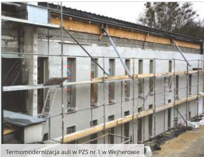
Termomodernizacja auli w PZS nr 1 w Wejherowie

Wartość zadania to 23 mln zł , z czego 20 mln zł pozyskano ze środków rządowych. Obiekt ma być gotowy na zakończenie wakacji, aby uczniowie mogli rozpocząć naukę w rozbudowanym kompleksie szkolnym z początkiem nowego roku szkolnego.