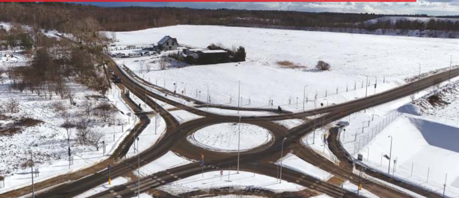
Nowe rondo w Łężycach

Zakończyły się prace drogowe na terenie gminy Wejherowo, w miejscowości Łężyce. Dzięki zadaniu u zbiegu ulic Obwodowej, Alei Parku Krajobrazowego oraz Wierzbowej powstało rondo, które zwiększy bezpieczeństwo i poprawi płynność ruchu.