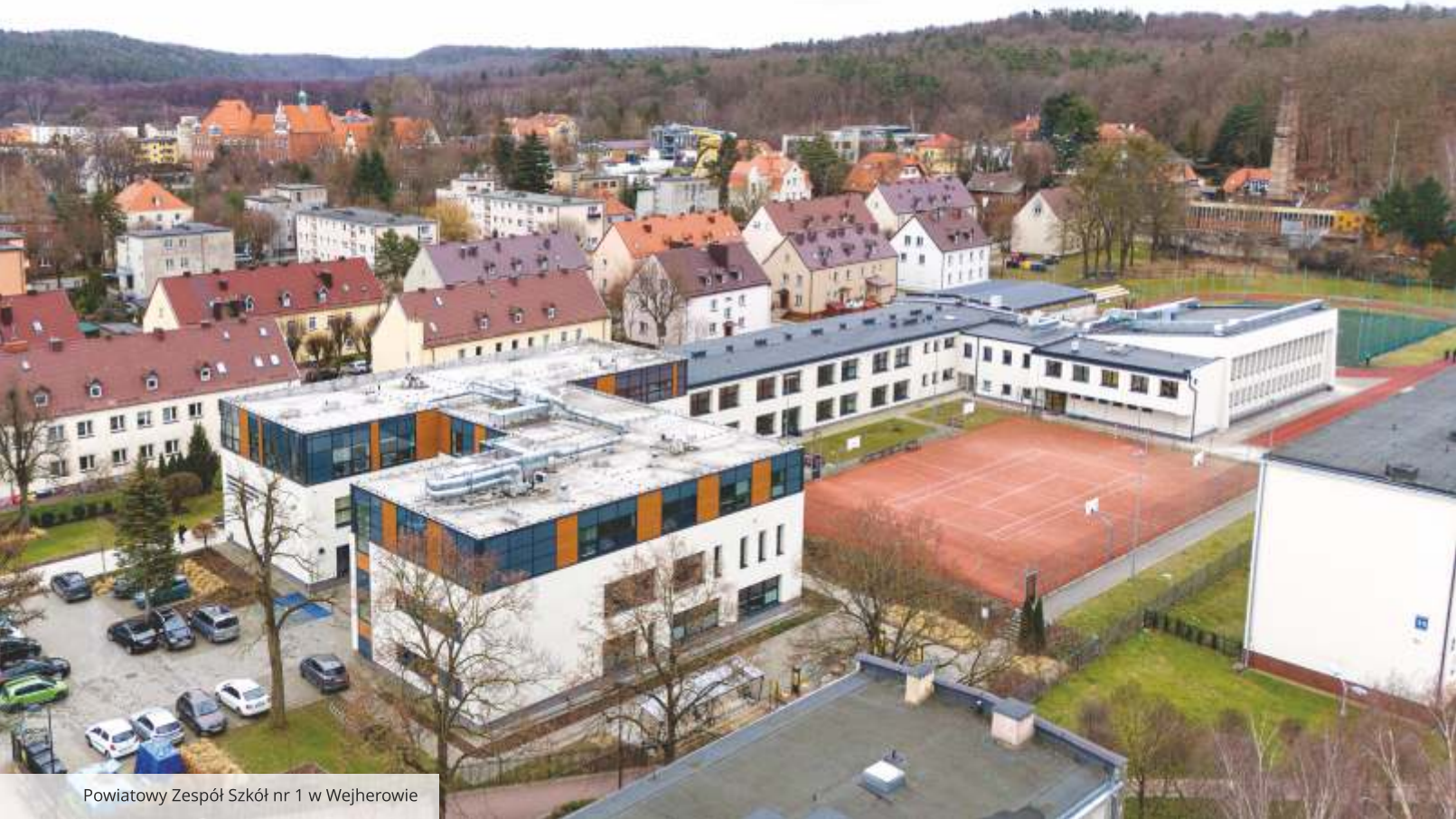
Powiatowy Zespół Szkół nr 1 w Wejherowie